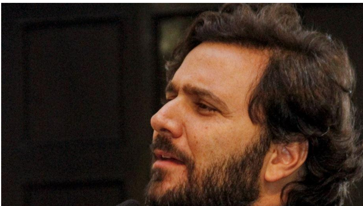
Deputado estadual Rodrigo Novaes (PSD)

Por: Blog da Folha em 09/03/17 às 11h32, atualizado em 09/03/17 às 11h35