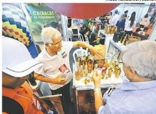
Evento tem perspectiva de atrair 30 mil pessoas

Também estão inclusos na programação 16 estandes dos chefs locais na praça de alimentação. A feira congrega também a 1ª Expo Avícola do Nordeste, a 6ª Feira dos Produ-