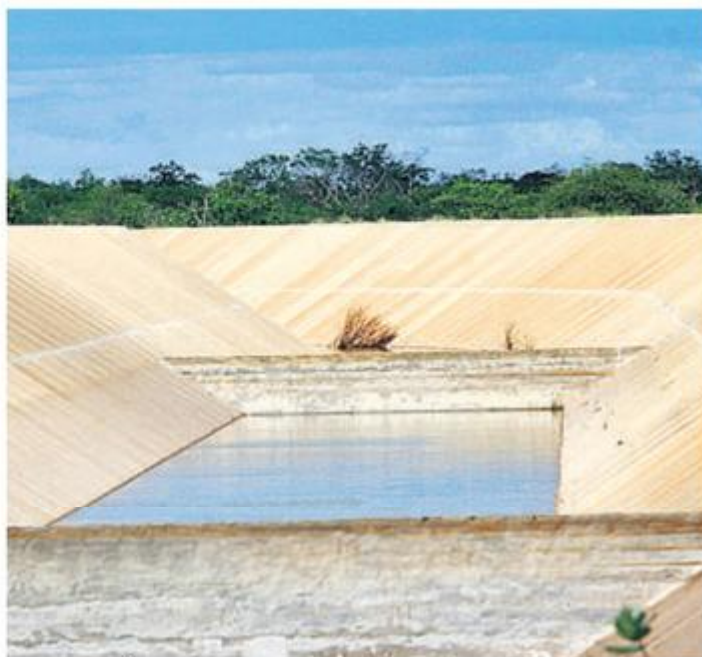
OPERAÇÃO Eixo Leste ainda está em fase de testes, diz ANA