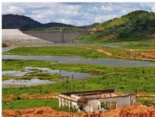
ABASTECIMENTO Canal captará água da barragem homônima

Assinada pelo governador Paulo Câmara (PSB), a convocação da audiência será publicada no Diário Oficial do Estado hoje. No evento, a diretoria da Companhia Pernambucana de Saneamento (Compesa) vai explicar e tirar dúvidas da população e construtoras interessadas em construir a obra.